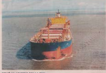
El Comercio, Miércoles 12 de marzo de 2008

Detienen a un joven que ingresó a un domicilio por la fuerza El menor de 18 años ingresó en la noche del 11 de marzo a un domicilio por la fuerza y se le incautó un arma. Se discuten los hechos y se busca mejorar el orden.