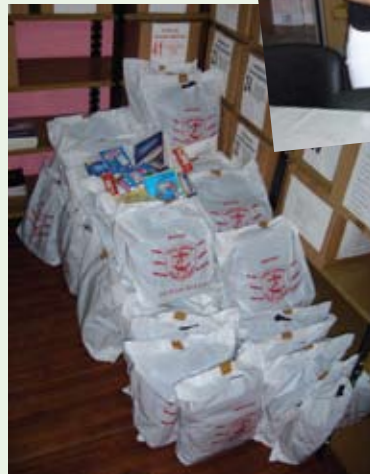
Útiles esperando chicos en el sindicato de Dragado y Balizamiento